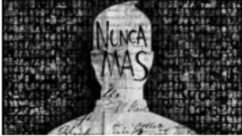
Historia y Definiciones