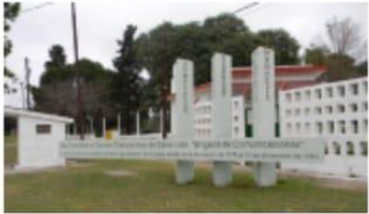
Campo de Mayo