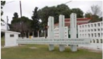
Campo de Mayo