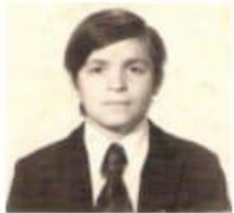
El caso: el "negrito" floreal avellaneda.

memoria y territorio Política y privacidad