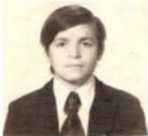
El caso: el "negrito" floreal avellaneda.