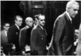
Enjuiciar el pasado cercano