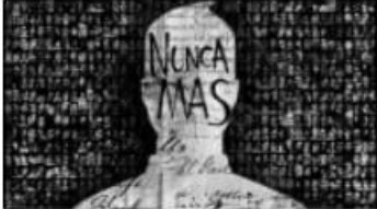
Historia y Definiciones