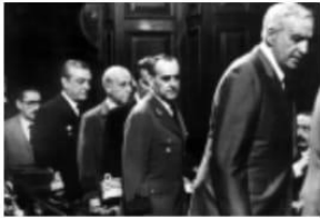
Enjuiciar el pasado cercano