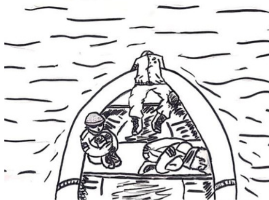
Dibujo hecho por el alumno Tobias Torterola (19 años)