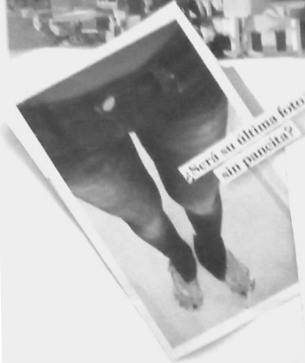
¿Será su última foto sin pancita?