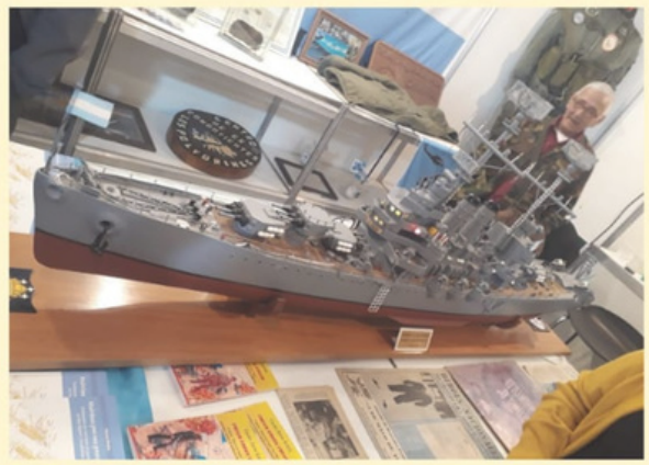
Nuestros excombatientes en la Feria del Libro Distrital