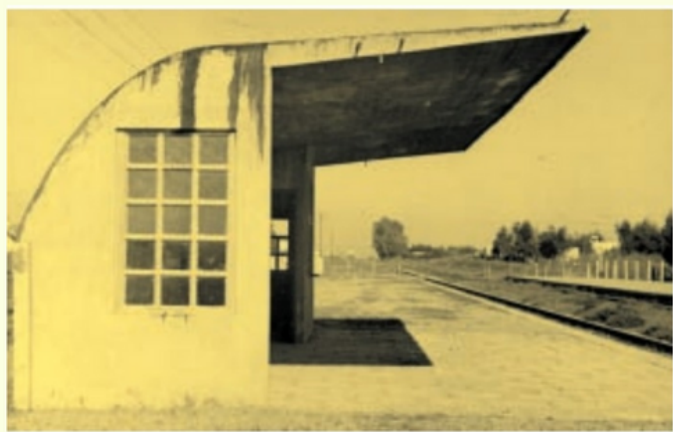
Primer refugio en la Estación de Km 30.

En 1953 un grupo de vecinos comenzaron a realizar gestiones para conseguir la parada del ferrocarril. Afrontando los gastos, para la construcción de los refugios y el relleno de una zona baja e inundable. La obra se demoraba ya que cada uno de las etapas debia contar con la aprobación del ferrocarril. Durante los primeros meses de 1955 se analizaron los trabajos y el 2 de mayo se inauguró la estación, con la presencia de autoridades que llegaron al lugar en el primer tren que paró allí. De esta manera comenzó a funcionar el apeadero Kilómetro 30.