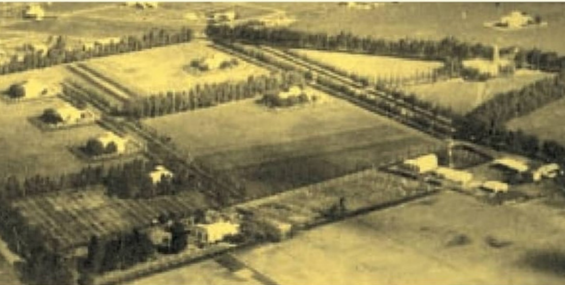
Vista aérea tomada a principios del siglo

Durante el primer mandato de Eduardo Duhalde, gobernador de la provincia de Buenos Aires, puso en marcha un plan para dividir los partidos grandes en municipios más chicos. El plan para dividirlos se llamo "Génesis 2000"