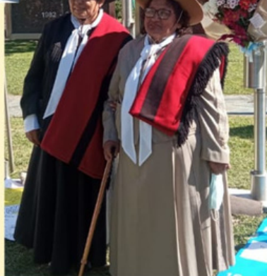
2 de abril 2022 homenaje a nuestros caídos de Malvinas con gauchos de Güemes en la rotonda de Uriburu y Oncativo Asourdeaux

Homenaje a nuestros caídos de Malvinas en la inmediaciones Del Palacio de Malvinas Argentinas