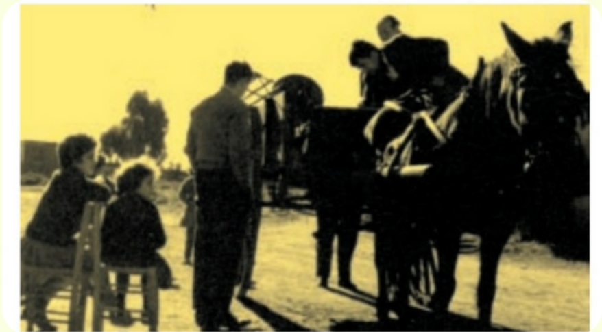
Un carro vendiendo Kerosen en los primeros años de la localidad

Dicha parada se ubicaría en el Km.30.762 pero esto no se concretaría hasta 1953