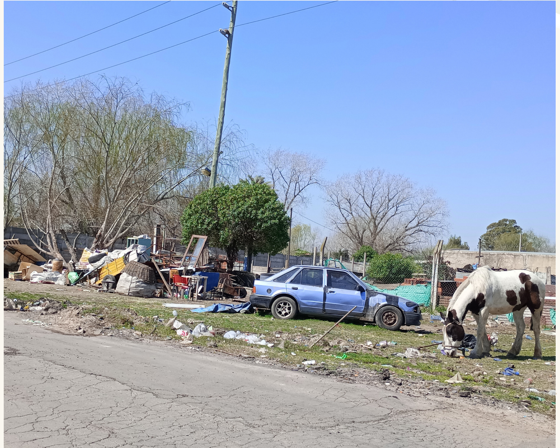
Basura y animales alrededor del barrio