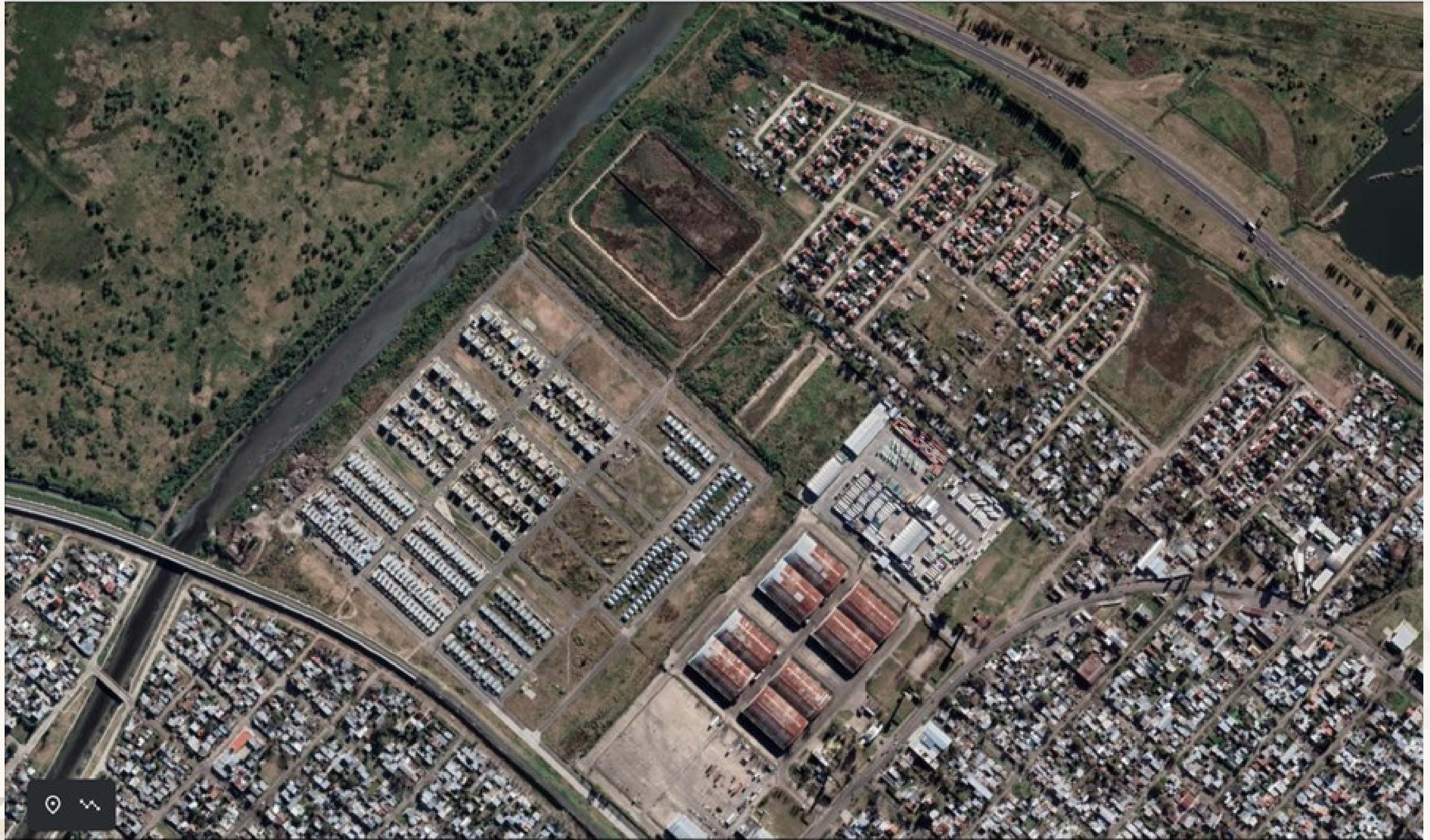
Mapa del Mercadito