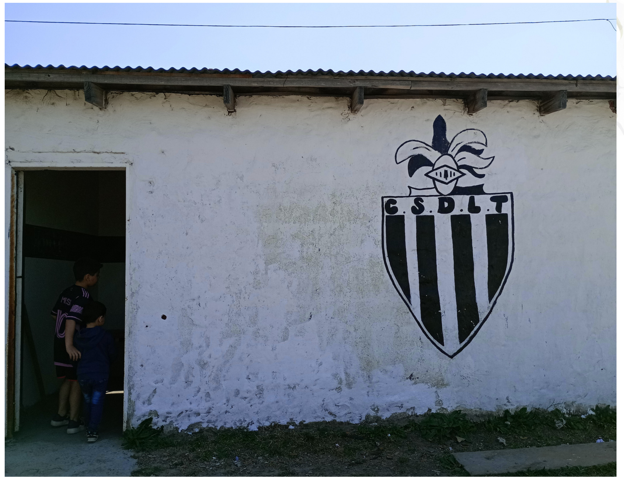
Vestidor del club "Los tolosanos"