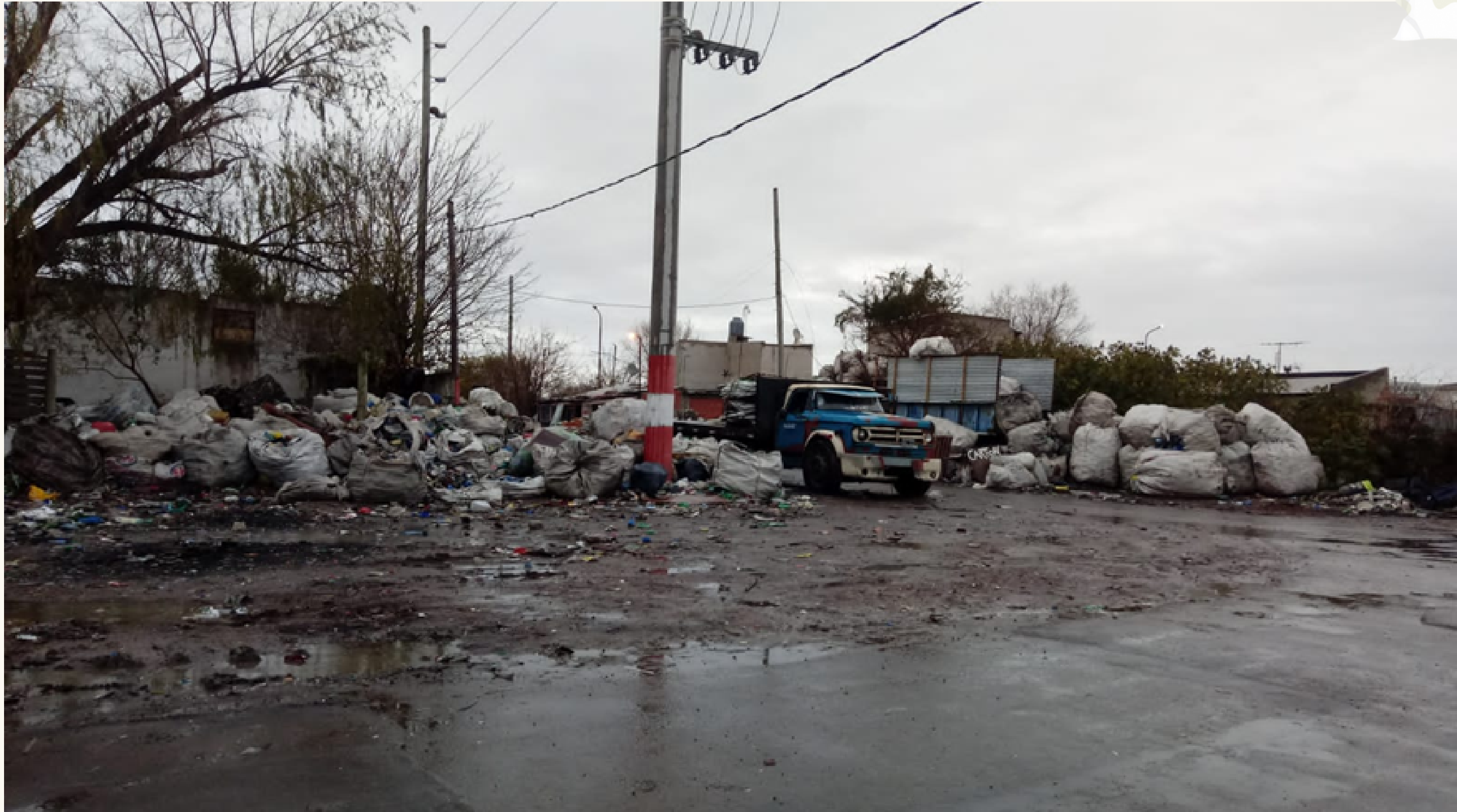
La entrada del Mercadito, se ve la ausencia del estado