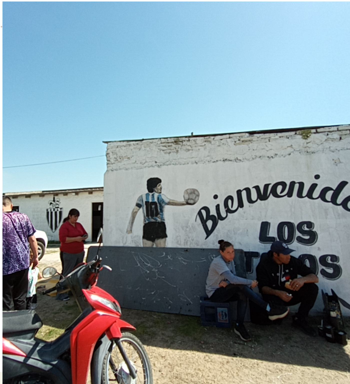
Entrada del Club "Los Tolosanos"