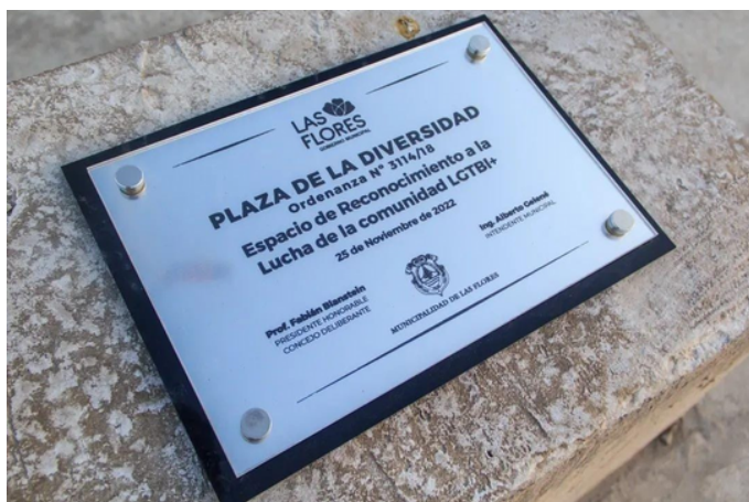
Plaza de la Diversidad. Ciudad de Las Flores

Con las tres entrevistas que leímos nos dimos cuenta que cada un@ paso por distintas experiencias personales, la mayoría descubren su sexualidad en la adolescencia, también les lleva tiempo descubrir o ver ese cambio que hay en ellos. Hay muchos pensamientos y emociones que se les vienen a la mente pero cuando ya lo descubren se sienten bien con ellos mismos. No todos lo pasan bien, pude que algunos sí, pero siempre se observan rastros de discriminación de la comunidad o de algunos miembros de la familia. Lo que necesitan es apoyo en alguien, en quien confiar un lugar donde no los juzguen como la familia, amigos, conocidos y el propio Estado. También está el hecho que en esos lugares que ellos piensan que pueden hablar no es lo que creían pueden que lo acepten o no.