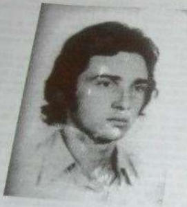
EL AMIGO DEL PUEBLO

con cada acto generico todos sus sentimientos ya sea, hacia su pueblo, a su familia, a su novia o a sus amigos. Estamos orgullosos del trabajo realizado y sabemos que ese Amigo del Pueblo del que hablaba Bayer hoy es nuestro Amigo y vive por siempre como un luchador valiente en nuestros corazones.