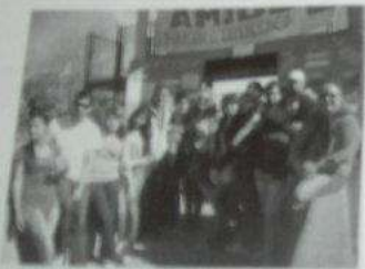
Homenaje a José en el parque de la Ciudad al cumplirse 35 años de su asesinato