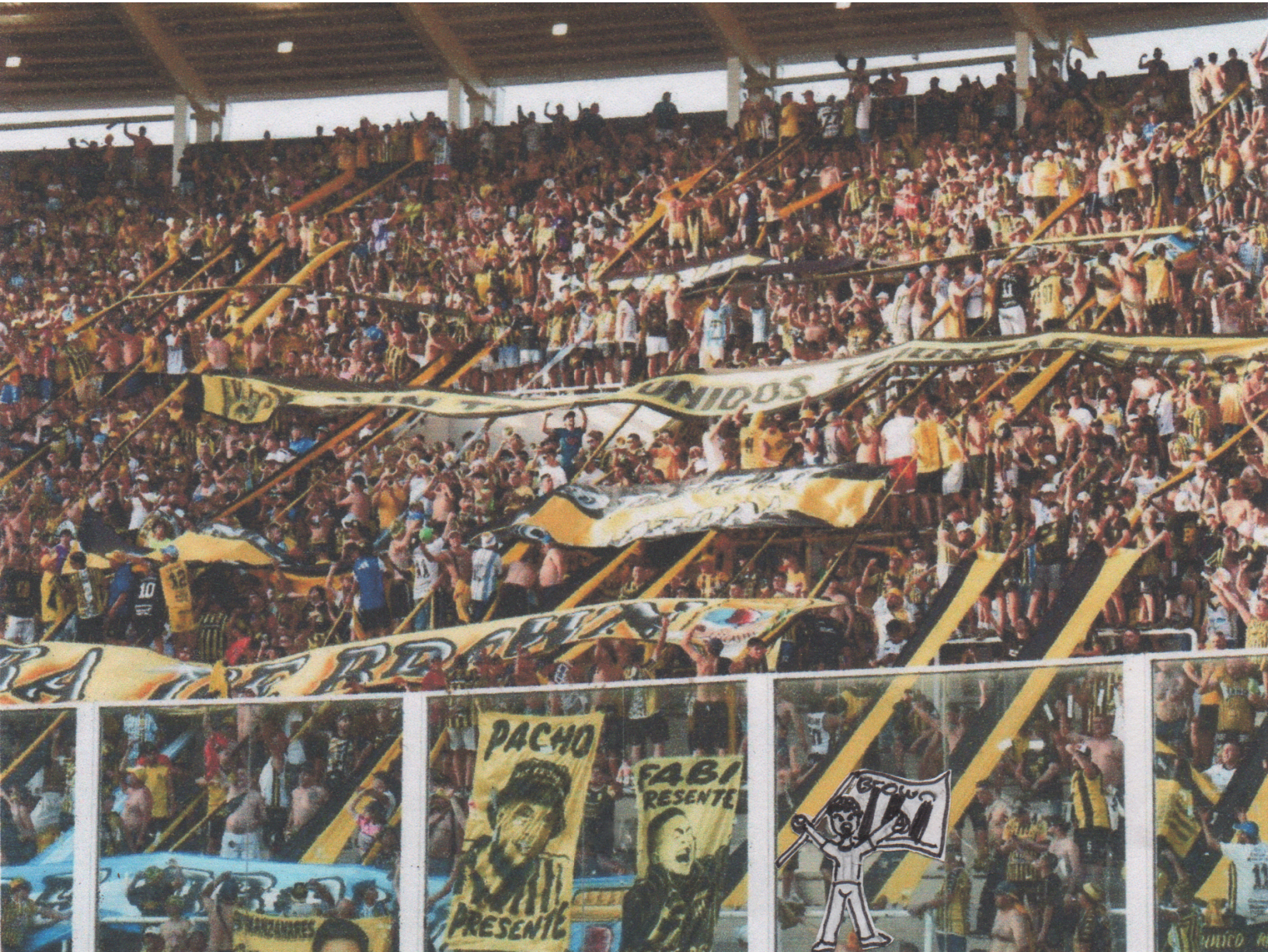
Tribuna de Almirante Brown el 29 de octubre de 2023 en el Estadio Mario Alberto Kempes de Córdoba en una nueva final por el ascenso a Primera

Mí voz quisieron callar pero mí alma y pasión nunca me las van a poder quitar