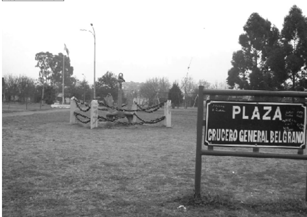
Plaza ubicada en Nuestras Malvinas al 2400

Evaluation Only. Created with Aupose Imaging. Copyright 2010 - 2024 Aupose Pty Ltd.