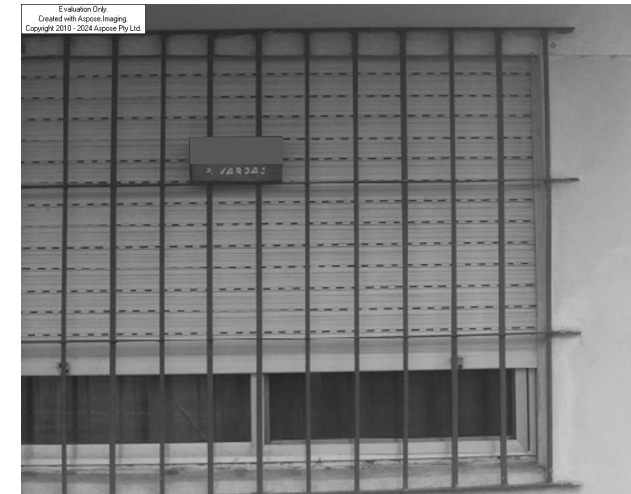
Única casa que lleva el nombre de un combatiente muerto en Malvinas (Plaza Combatientes de Malvinas)