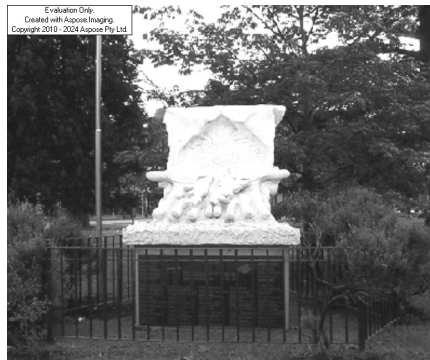
Monumento a los veteranos de guerra y caídos en las Islas Malvinas