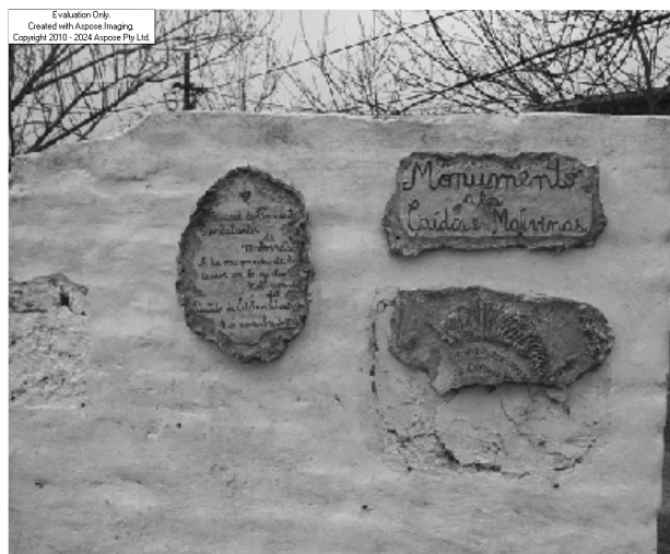
Monumento ubicado en Nuestras Malvinas al 1700

Evaluation Only. Created with Aupose Imaging. Copyright 2010 - 2024 Aupose Pty Ltd.