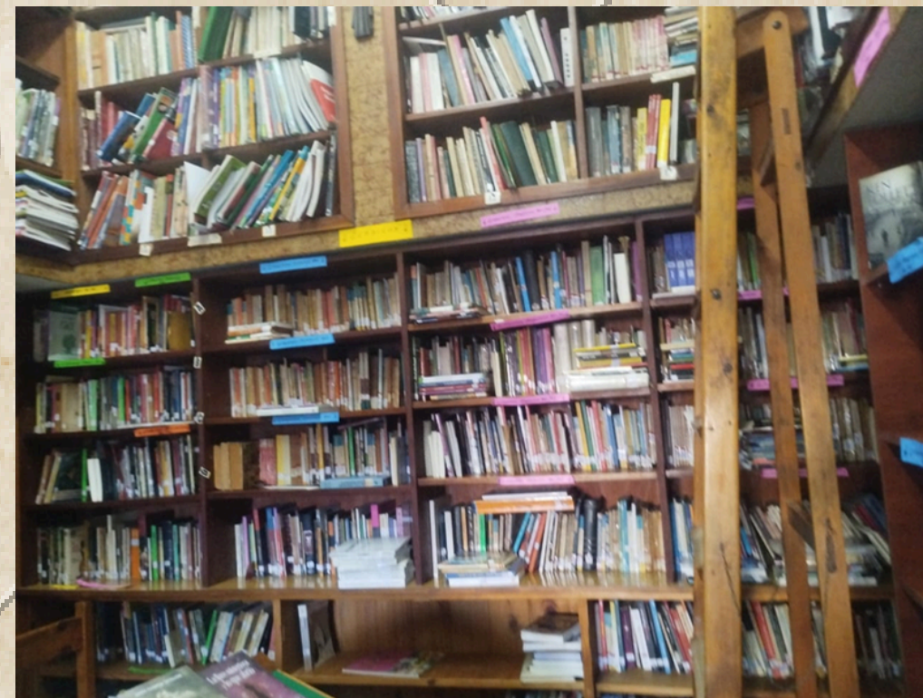
Foto de la Biblioteca Popular J.M. Estrada

En un contexto donde persisten desafíos vinculados con la desigualdad social, la falta de recursos y las brechas tecnológicas, las bibliotecas populares representan núcleos de inclusión y transformación social .